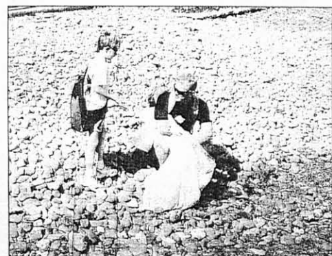
À peine arrivé sur l'île, les bénévoles ne chôment pas et commencent à ramasser les déchets, souvent les mêmes : plastiques, canettes...