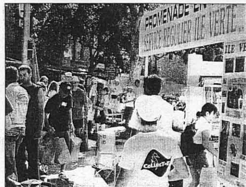
10 h hier matin : c'est l'heure du départ avec l'aide des navettes reliant le Port vieux à l'île verte.

3 m 3 ont ainsi été récupérés par les nombreux participants, qui en profitaient pour découvrir ce joyau vert, à travers les exposés historique et écologique des représentants de CRI Nature et l'Atelier bleu. Une belle réussite qui mérite d'être soutenue et développée.